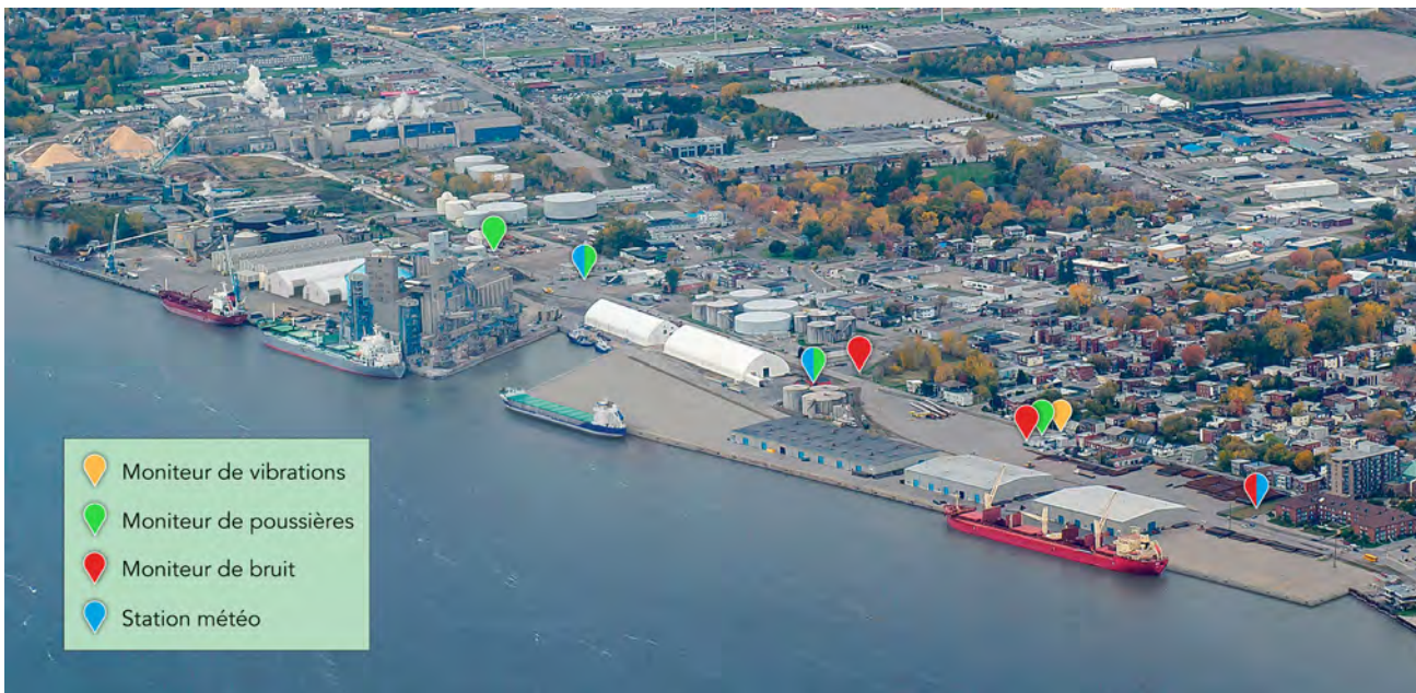
Localisation des moniteurs de suivi du Port

Ces outils permettent à la communauté portuaire d'approfondir la connaissance des mesures générées, de compléter un processus de veille préventive efficace et d'initier des interventions rapides lorsque cela s'avère nécessaire. Ils permettent de plus de travailler, en collaboration avec nos manutentionnaires, à définir des indicateurs et convenir d'un plan d'action visant l'amélioration continue afin de combler les écarts entre la situation identifiée et celle désirée.